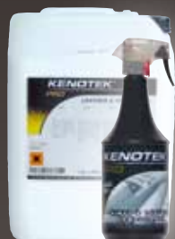
12X1 L / 20 L

(RU) Средство для восстановления и защиты пластика и кожи. Нанесите средство на поверхность и равномерно разотрите. Оставьте на некоторое время. Для достижения результата протрите поверхность сухой тканью без ворсинок или салфеткой. Не наносить на руль управления, рычаг коробки передач и педали.