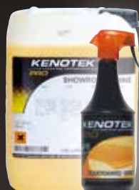
12X1 L / 20 L

(RU) Восстанавливает лакокрасочное покрытие и придает блеск. Удаляет отпечатки пальцев и пыль. Нанесите полироль на чистую и сухую поверхность автомобиля и разотрите ее микрофибровой тканью. Подходит для всех видов лакокрасочного покрытия автомобилей. Продукт антистатичен.