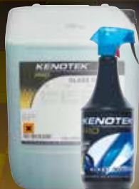
12X1 L / 20 L

(RU) Чистит без разводов: стекла, зеркала, пластик и хром. Удаляет следы никотина. Нанесите продукт на поверхность и удалите его при помощи ткани без ворсинок или бумаги.